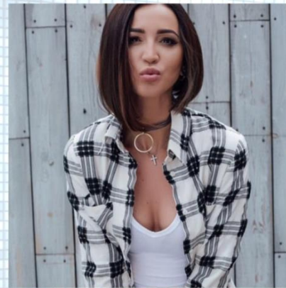
Фото для рекламы