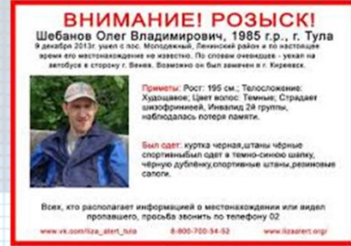
Использование изображения в общественных интересах