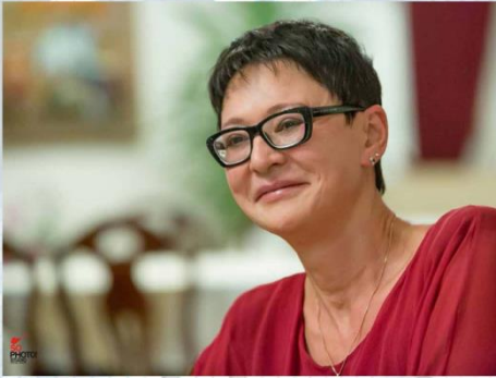
7. Ирина Хакамада