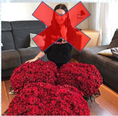
Личное фото в домашней обстановке