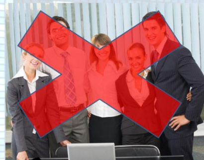
Фото рабочей коллектива