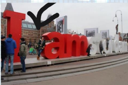
Публичное место (доступности, улица, магазин)