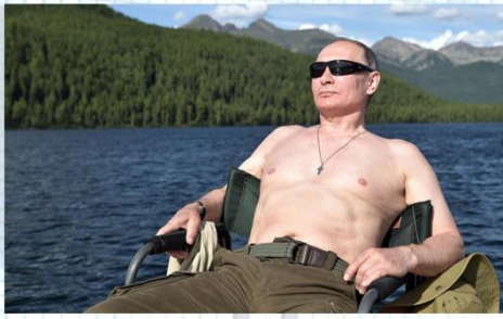
Использование изображения в гос. целях (не личное фото в домашней обстановке)