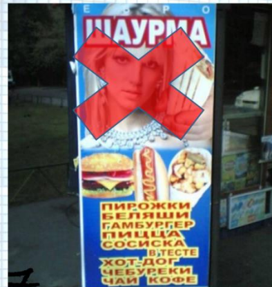
Фото Бритни Спирс на рекламе